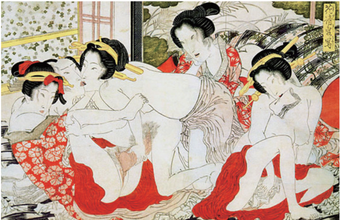
『春野薄雪』 溪斎英泉